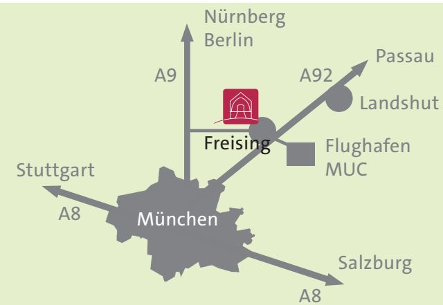
Titelbild: Marios Pavlou: Backflip.Wave.Splash , digitale Collage, 11 x 6 cm, 2023 ▶ Ausstellung VerSpielT | Fokus > Europa VII