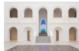
© James Turrell

Für eine individuelle Buchung im Rahmen einer exklusiven, halbstündigen Sonderöffnung wenden Sie sich bitte an kunstvermittlung@dimu-freising.de (Gebühr € 50,- pro Buchung)