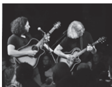
© Manu Glück und Lena Nieder

Veranstalter: Stadtjugendpflege Freising