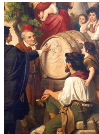
Johann Michael Wittmer, Raffael malt die Madonna, Mitte 19. Jh. (Detail)

Kunst zeitgemäß ausdrücken lassen. König Ludwig I. blickte zunächst sehnsuchtsvoll nach Italien auf der Suche nach Inspirationen und gab der kirchlichen Kunst eine neue Richtung. Ab der Mitte des Jahrhunderts wurden die offiziellen Grenzen jedoch zu eng und selbstbewusste Künstlerinnen und Künstler ließen ihrer Fantasie freien Lauf – das vielfältige Ergebnis ihrer Suche nach dem richtigen Ausdruck zeigt diese Ausstellung mit Werken von u. a. Friedrich Overbeck, Peter von Cornelius, Maria Ellenrieder, Emilie Linder, Carl Spitzweg, Fritz von Uhde, Franz von Lenbach, Gabriel von Max, Franz von Stuck, Wassily Kandinsky, Franz Marc, Gabriele Münter und Marianne von Werefkin.